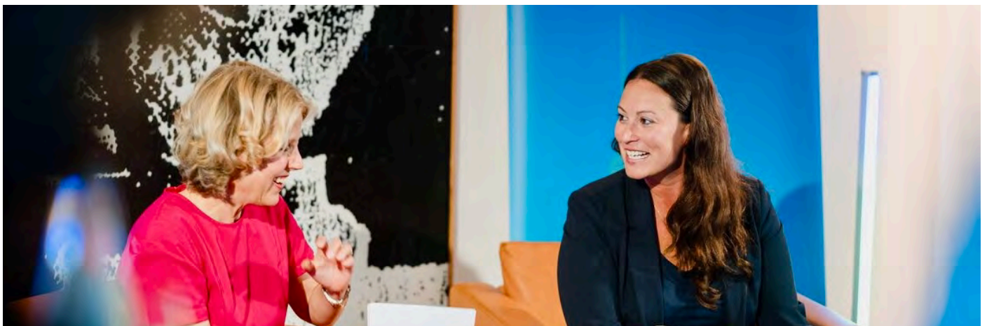
Im Gespräch bei der Digital Summer Lounge der IHK