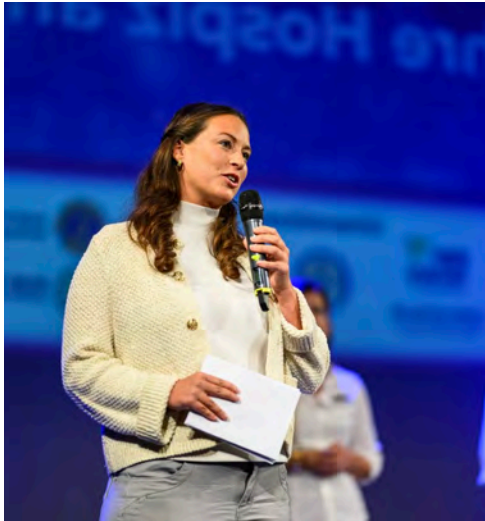
Caroline Bosbach moderiert das Benefizkonzert des Hospizes am Quirlsberg

Natürlich gehören auch Gespräche mit Verbänden, Unternehmen und Interessenvertretern dazu. Auch das gehört zur parlamentarischen Arbeit: zuhören, abwägen, entscheiden. Gleichzeitig bedeutet ein Bundestagsmandat natürlich auch, plötzlich stärker im öffentlichen Fokus zu stehen. Mitunter kommt auch Gegenwind, aber auch das gehört zu einer Demokratie dazu.