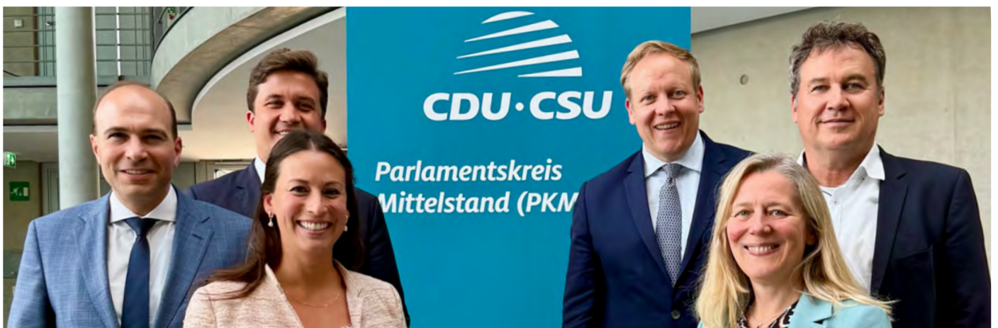
Der Vorstand des Parlamentarischen Ausschusses Mittelstand der CDU/CSU Bundestagsfraktion

Als stellvertretende Vorsitzende des Parlamentarischen Ausschusses Mittelstand (PKM) liegt mir besonders die Situation unserer kleinen und mittelständischen Unternehmen am Herzen. Viele Unternehmer berichten nach wie vor von großen Herausforderungen, etwa durch Bürokratie, Energiekosten oder Fachkräftemangel. Gleichzeitig gibt es auch positive Rückmeldungen, etwa zur Senkung der Mehrwertsteuer in der Gastronomie.