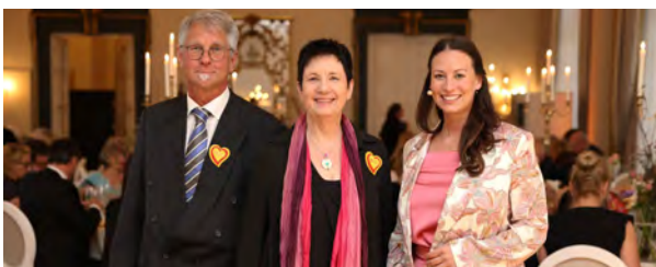
Mit Vertretern des ASB-Wünschewagens Rheinland

Als stellvertretende Vorsitzende des Parlamentarischen Ausschusses Mittelstand (PKM) liegt mir besonders die Situation unserer kleinen und mittelständischen Unternehmen am Herzen. Viele Unternehmer berichten nach wie vor von großen Herausforderungen, etwa durch Bürokratie, Energiekosten oder Fachkräftemangel. Gleichzeitig gibt es auch positive Rückmeldungen, etwa zur Senkung der Mehrwertsteuer in der Gastronomie.